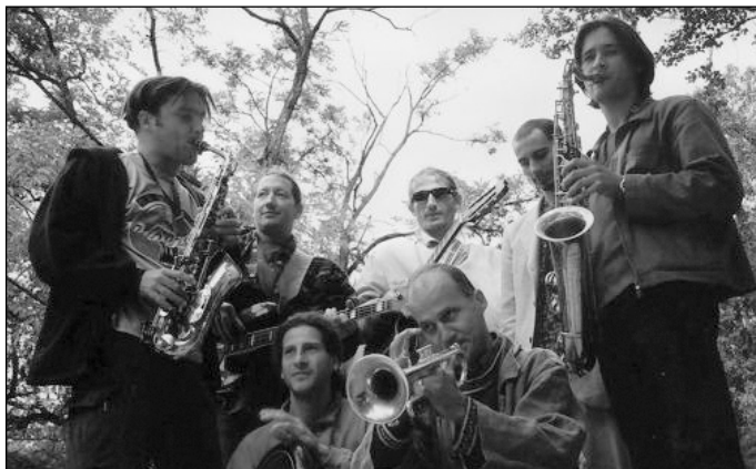
Besh o Drom